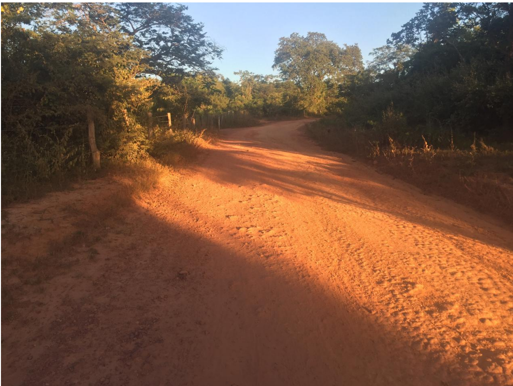
FOTO N° 03: IMAGEM DO INICIO TRECHO 02 A SER PAVIMENTADO – ANTES DA OBRA