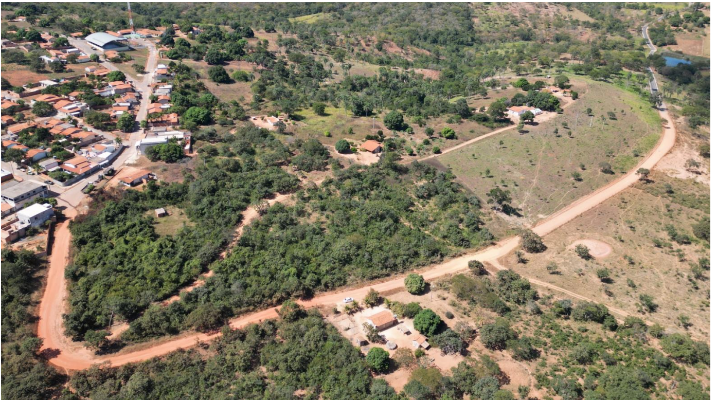
FOTO N° 10: IMAGEM DO TRECHO 02 A SER PAVIMENTADO – ANTES DA OBRA