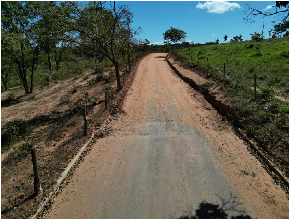
FOTO N° 09: IMAGEM DO INICIO DO TRECHO 02 A SER PAVIMENTADO – ANTES DA OBRA