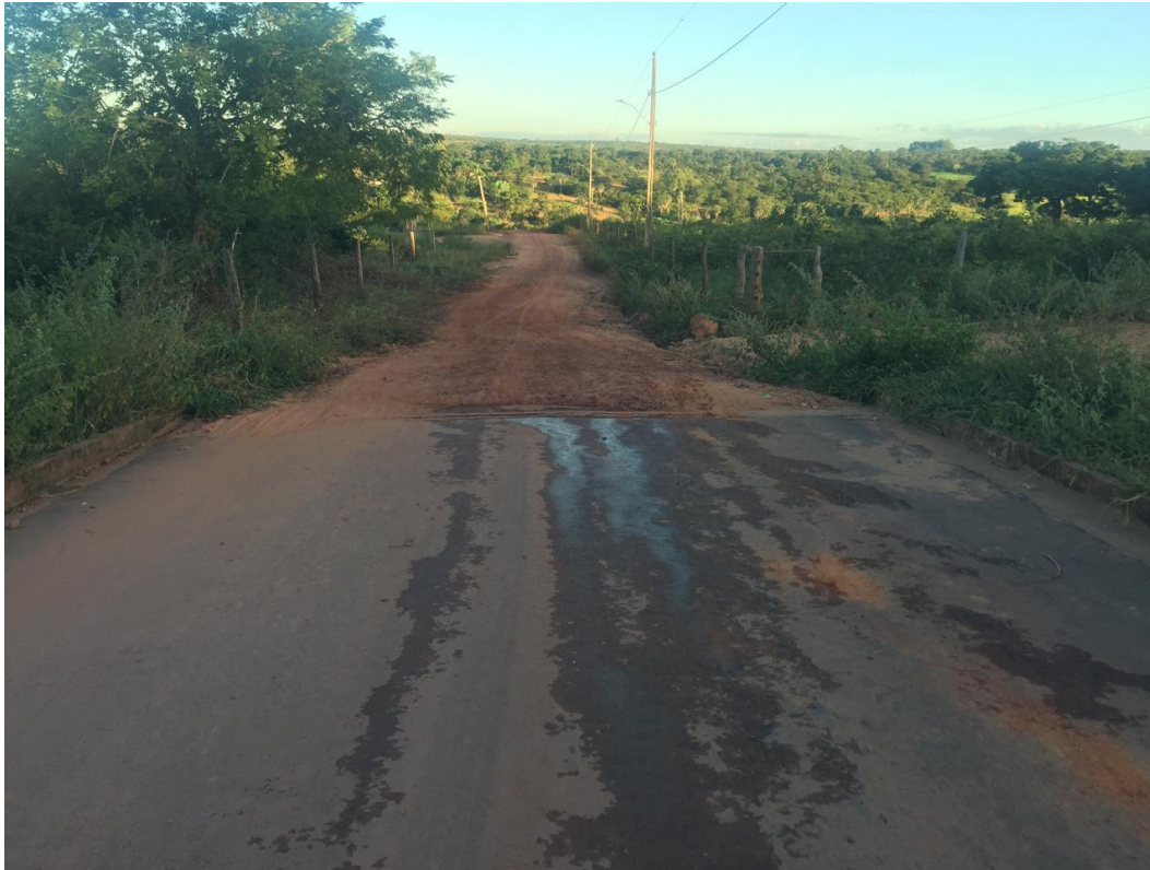
FOTO Nº 06: IMAGEM DO FINAL DO TRECHO 03 A SER PAVIMENTADO – ANTES DA OBRA