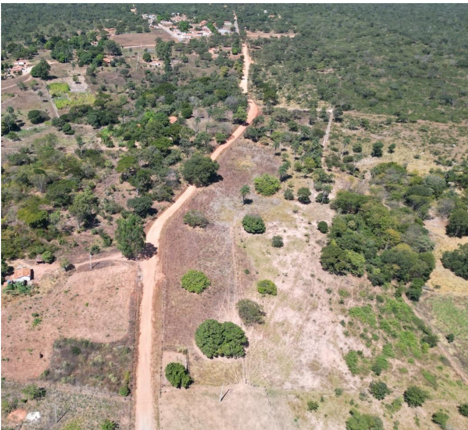
FOTO Nº 08: IMAGEM DO TRECHO 01 A SER PAVIMENTADO – ANTES DA OBRA