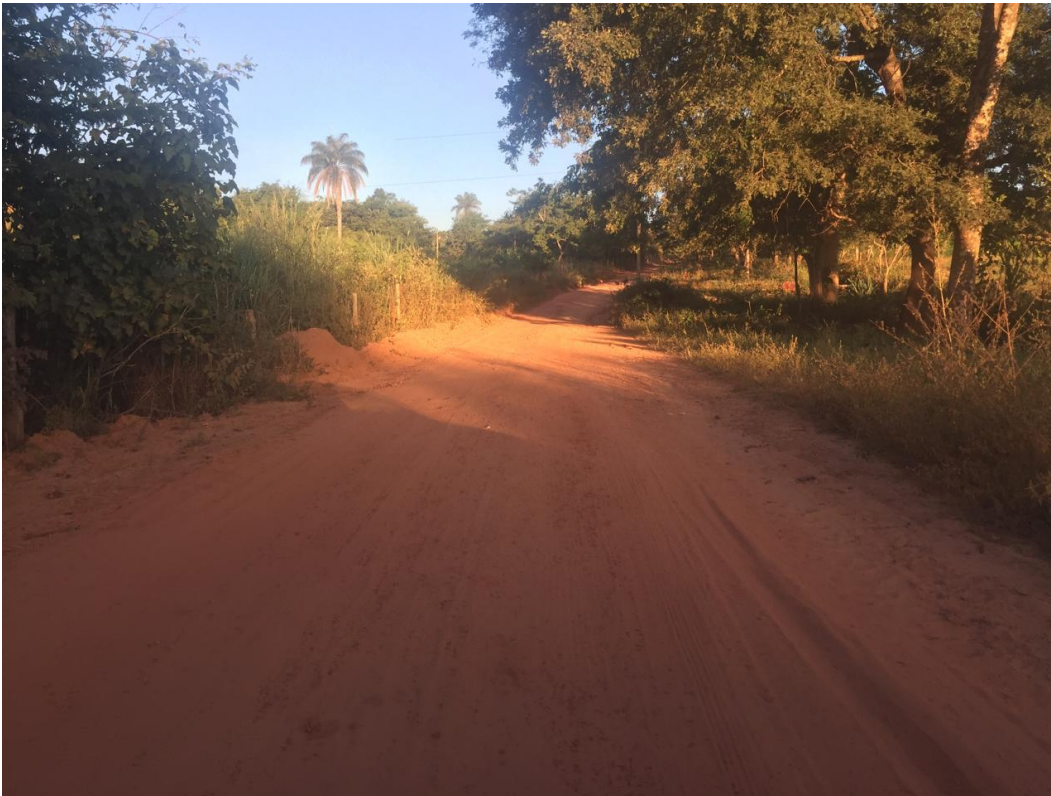
FOTO N° 05: IMAGEM DO INICIO DO TRECHO 03 A SER PAVIMENTADO – ANTES DA OBRA