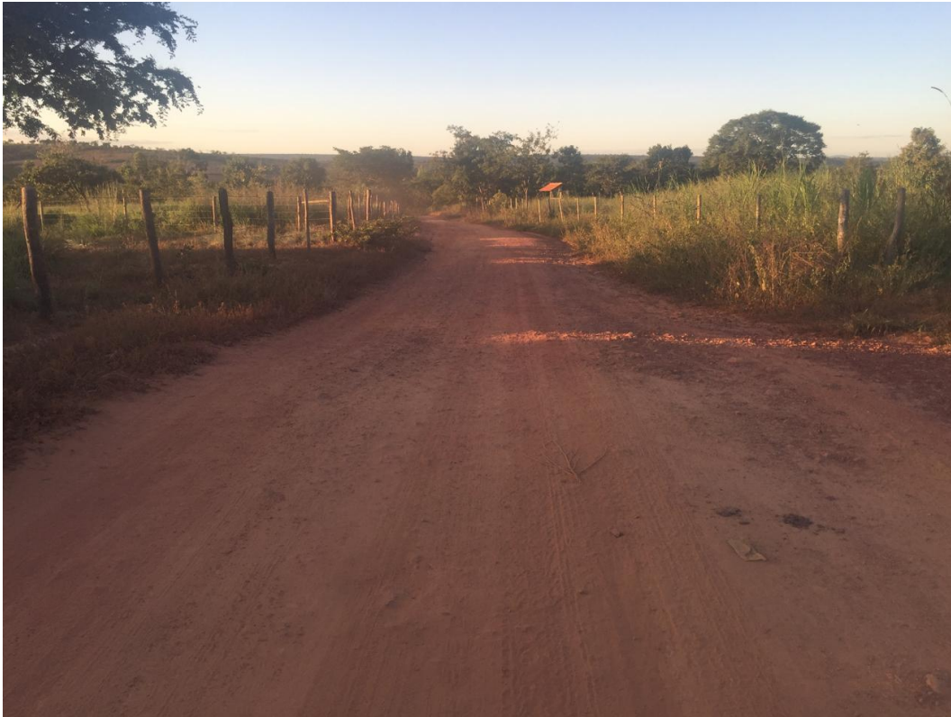
FOTO N° 04: IMAGEM DO FINAL DO TRECHO 02 A SER PAVIMENTADO – ANTES DA OBRA