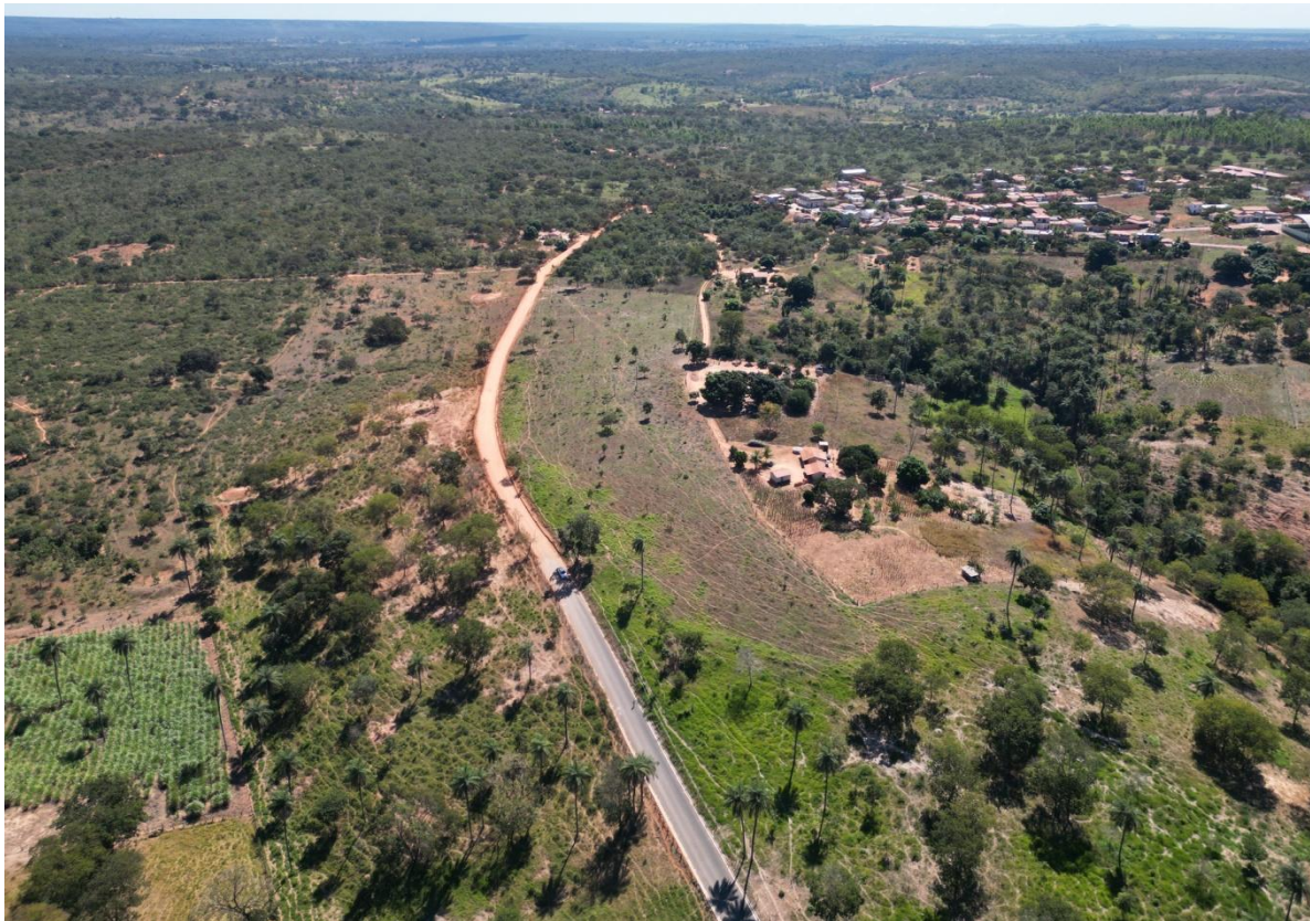
FOTO N° 11: IMAGEM DO TRECHO 02 A SER PAVIMENTADO – ANTES DA OBRA