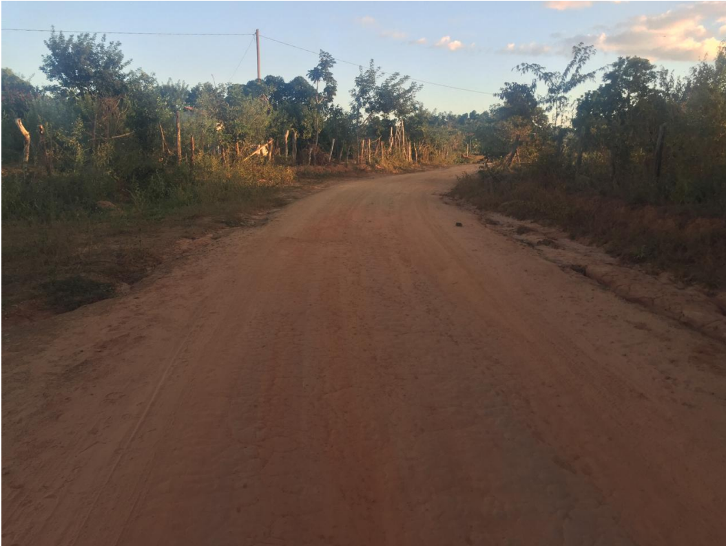
FOTO N° 02: IMAGEM DO FINAL DO TRECHO 01 A SER PAVIMENTADO – ANTES DA OBRA