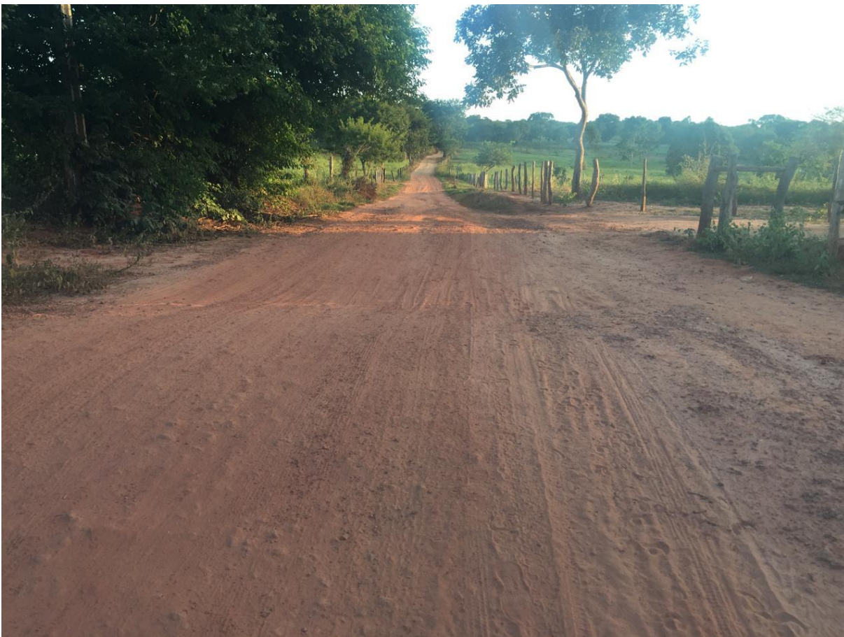
FOTO Nº 01: IMAGEM DO INICIO DO TRECHO 01 A SER PAVIMENTADO – ANTES DA OBRA