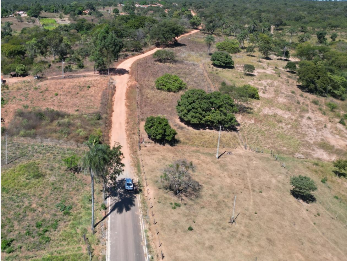
FOTO Nº 07: IMAGEM DO TRECHO 01 A SER PAVIMENTADO – ANTES DA OBRA